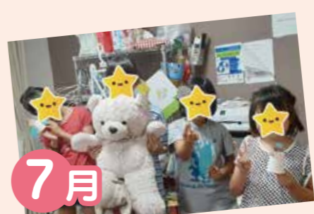
7月 七夕 短冊に願いを込めて書いたり、飾りつけをたくさんしました。