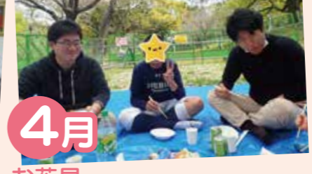
4月 お花見 新年度始まって最初の行事。みんな楽しく食事することができました。