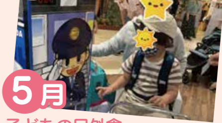
5月 子どもの日外食 各ホームでお出かけをして楽しみました。