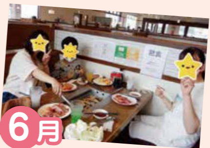
6月 誕生日外食 いつもと違う食事でお腹いっぱい食べました!!