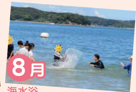
8月 海水浴 毎年恒例の行事です(´艸`)。精一杯遊ぶことができみんな満足していました。