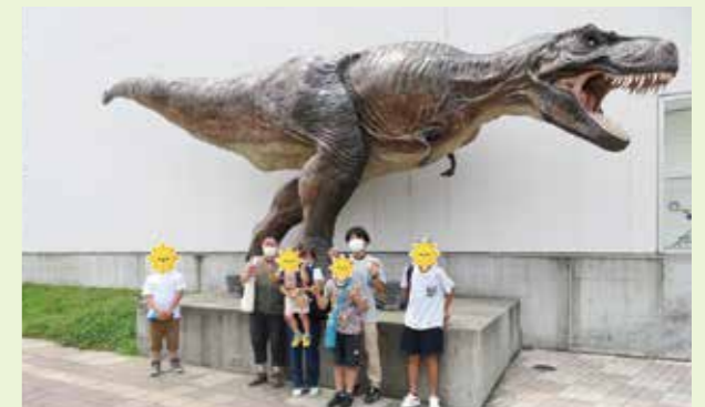
▲「しゃくやくホーム」御船町恐竜博物館に行きました。