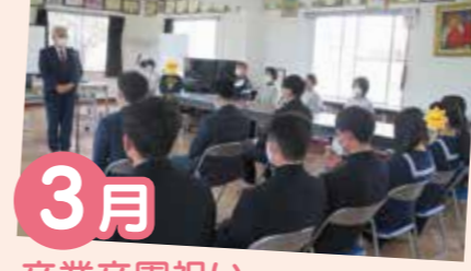
3月 卒業卒園祝い 昨年度は卒園生3名でした。皆様のご活躍を期待しています!!