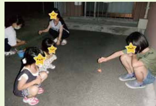
▲「あさがおホーム」みんなで花火を楽しみました。

今年度もホームで、計画を立て活動しています。まだまだ行動が制限される中、工夫して各ホーム様々な活動を行い、職員も子どもたちもとても楽しんでいるようです。引き続き状況を見ながら年間通して活動を行って行きたいと思っております。